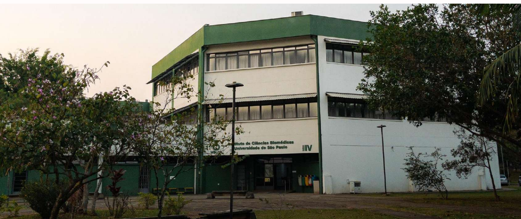
Instituto de Ciências Biomédicas (ICB)

Localizado na Cidade Universitária em São Paulo e com subunidades em Monte Negro (RO) e Acrelândia (AC), é composto por 7 departamentos e possui uma infraestrutura completa com mais de 150 laboratórios. Atualmente, o ICB possui 5 Programas de Pós-graduação (PPGs) e é sede de 2 Programas Inter-unidades.