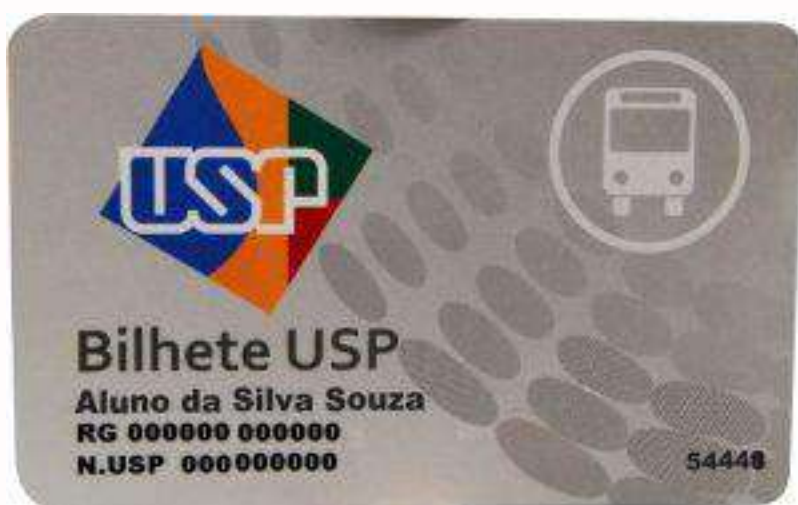
Bilhete USP (BUSP)

Na Estação Butantã, há um terminal de ônibus que oferece acesso à Cidade Universitária. Você pode pegar as linhas 8082-10 ou 8083-10 e descer na parada “ICB”. Essas linhas são gratuitas para estudantes que utilizam o Bilhete USP (BUSP) , disponível após o ingresso na pós-graduação. Acesse as rotas no link .