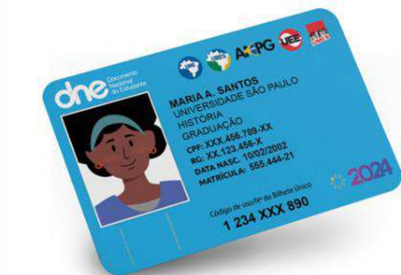
Bilhete Único de Estudante

Como pós-graduando, você tem direito ao Bilhete Único de Estudante. Ele lhe dá o direito de pagar apenas metade da tarifa dos transportes públicos. Consulte a secretaria da sua pós-graduação para saber como solicitá-lo.