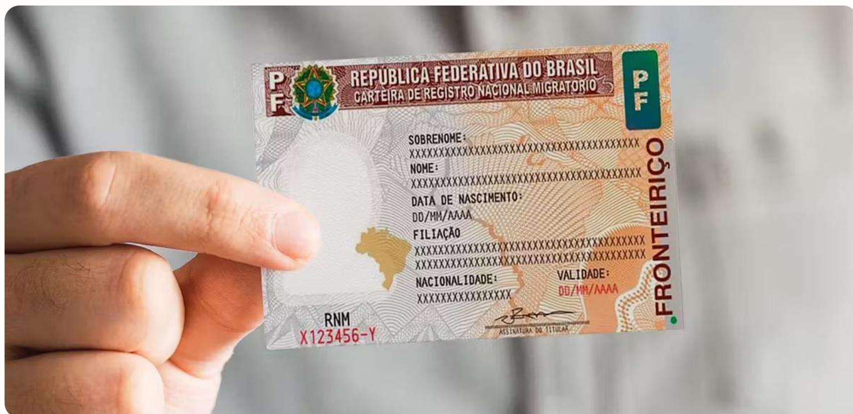
Registro Nacional Migratório (RNM)

Para efetuar sua matrícula no programa de pós-graduação, é necessário apresentar o Visto Temporário IV e, em seguida, obter um Registro Nacional Migratório (RNM). O visto é concedido diretamente pelos Consulados Brasileiros mais próximas do domicílio do estrangeiro. Para o RNM, você deverá marcar uma entrevista na Polícia Federal. Para mais informações, acesse o Escritório de Cooperação Internacional da USP . A secretaria do seu programa de pós-graduação e a Comissão de Cooperação Nacional e Internacional-ICB ( ccnint@icb.usp.br ) também podem ajudá-lo.