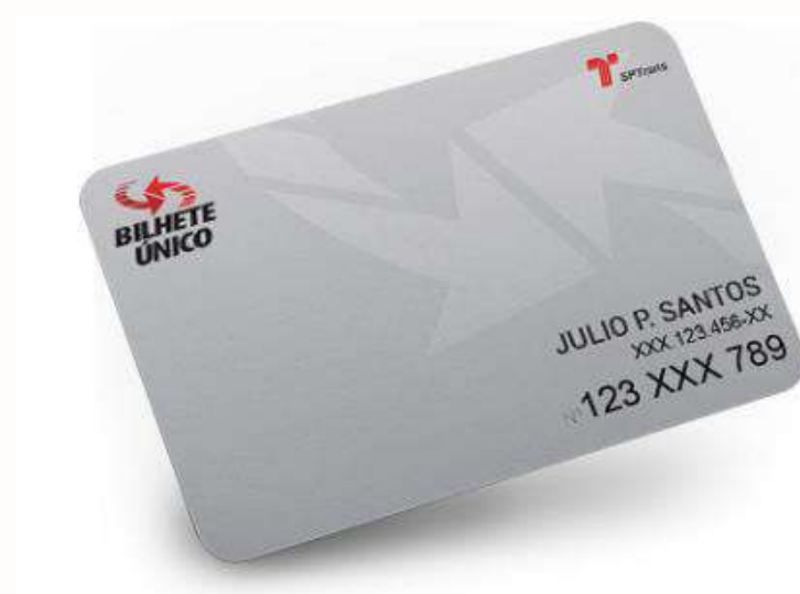
Bilhete Único Comum

O Bilhete Único é uma maneira prática de pagar as passagens em todos os meios de transporte mencionados. Para adquiri-lo, você deve se cadastrar no site oficial e depois retirar o cartão em um posto de atendimento. Ele pode ser recarregado online ou em vários pontos pela cidade.