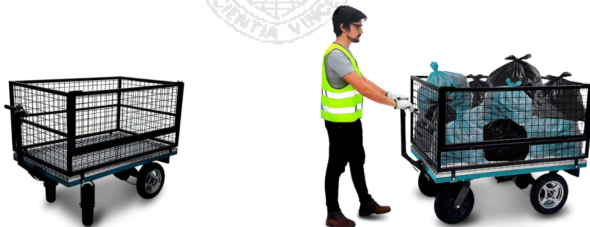
Figura 1: imagens meramente ilustrativas do modelo de veículo