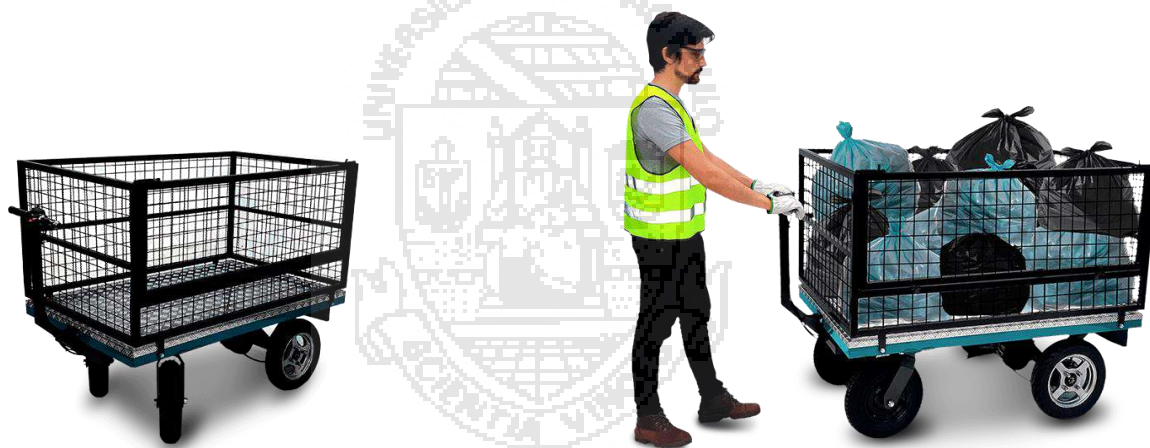
Figura 1: imagens meramente ilustrativas do modelo de veículo

2.1 O veículo deve possuir eixo de tração composto por um motor elétrico, silencioso e não poluente (alimentado por baterias recarregáveis), acoplado em uma caixa diferencial banhada com Óleo 90 para lubrificação. Não deve fazer uso de combustível;