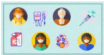
Ilustração Luana Franzão / Jornal da USP

Desmatamento da Mata Atlântica, em cujos domínios vivem dois terços da população brasileira, preocupa: ganha força no mundo conceito de equilíbrio com meio ambiente para garantir saúde. (O Globo)