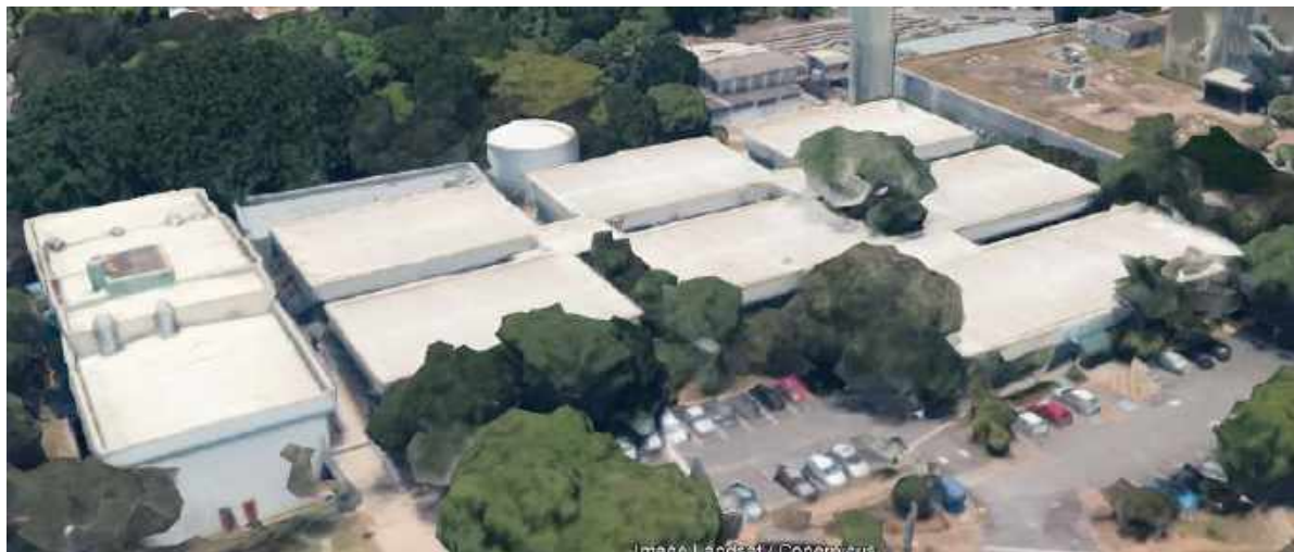
Figura 1: Vista aérea - ICB III e anexo BMA - Vista A