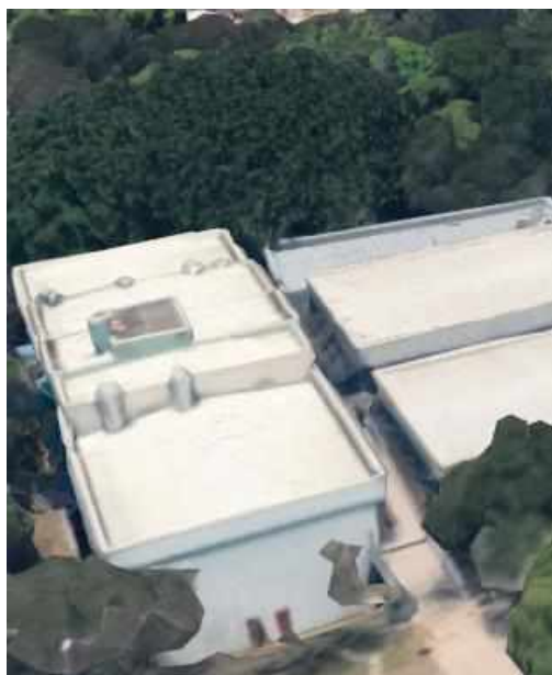
Figura 3: Vista aérea Prédio Didático do Departamento de Anatomia – ICB III