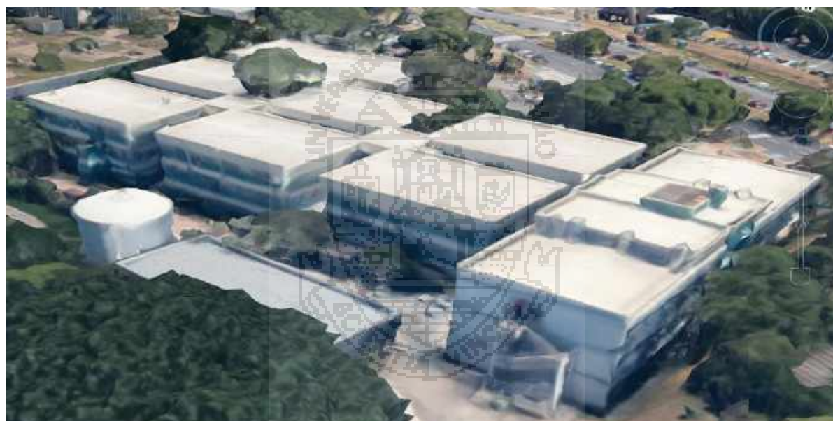
Figura2: Vista aérea - ICB III e anexo BMA – Vista B