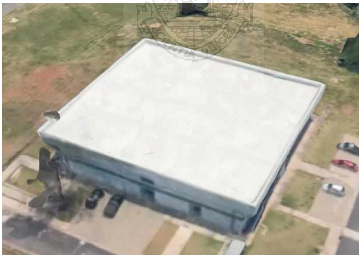
Figura 4: Vista aérea – Prédio Biotério de Ratos