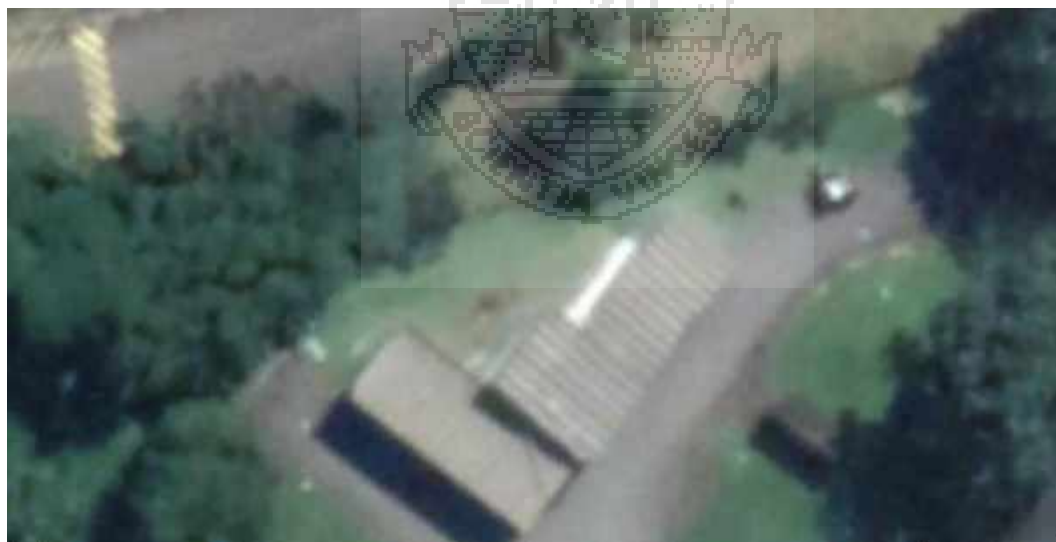
Foto aérea com baixa definição, local a disposição para vistoria.

Instituto de Ciências Biomédicas IV: Av. Prof. Lineu Prestes, 1730 – Cidade Universitária – Butantã SP/SP – CEP 05508-000.