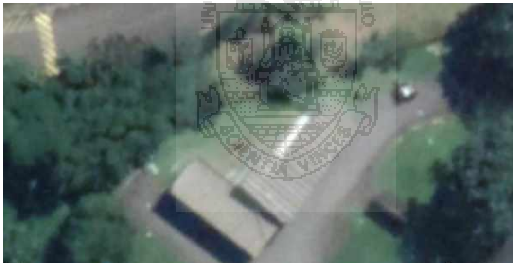
Foto aérea com baixa definição, local a disposição para vistoria.

Instituto de Ciências Biomédicas IV: Av. Prof. Lineu Prestes, 1730 – Cidade Universitária – Butantã SP/SP – CEP 05508-000.